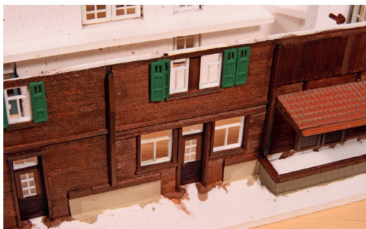
Die Fensterläden aus Kunststoff sind von Kibri und haben einen grünen Anstrich erhalten, bevor sie neben die Fenster geklebt wurden.

sodass man es abnehmen kann, um an das Innere des Gebäudes zu gelangen. Dazu wurden die Dachflächen auf Kartonstücke geklebt, die der Dachneigung der Giebelwand entsprachen. Die Dachflächen wurden so montiert und konnten passgerecht auf das Gebäude gesteckt werden. Hier sollte man so lange arbeiten, bis ein spaltenfreier Sitz zwischen Aussenwänden und Dach gegeben ist. Die über die Aussenwände hinausragenden Unterseiten der Dachflächen erhielten eine Verkleidung aus