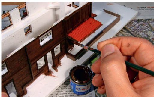
Die Kunststoffbereiche und etwaige von Kleber bedeckte Stellen können ganz einfach mit matten Bastelfarbe überstrichen werden.