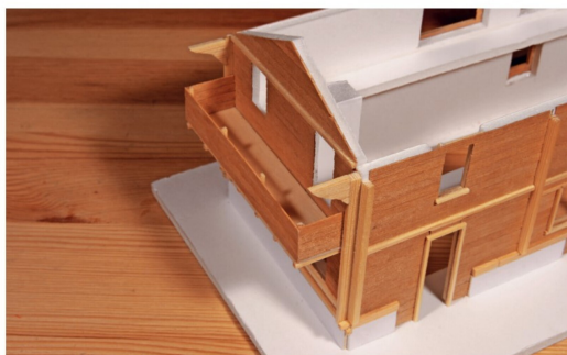
Auch Verzierungen und Architekturelemente wie hier über dem Balkon können aus Holz erstellt werden.