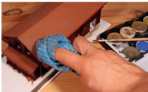
Wasserfarben eignen sich zum Altern des Daches. Diese wird satt aufgetragen und mit einem feuchten Lappen entfernt.