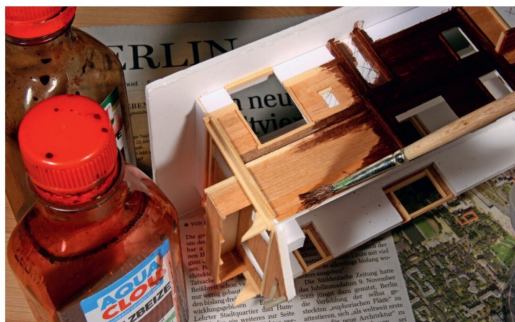
Die typisch dunkelbraune Farbe erhält die Holzoberfläche durch Holzbeize. Die Beize kann beliebig oft aufgetragen werden.