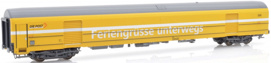
Der Postwagen 599 mit dem deutschen Werbeslogan «Feriengrüsse unterwegs».