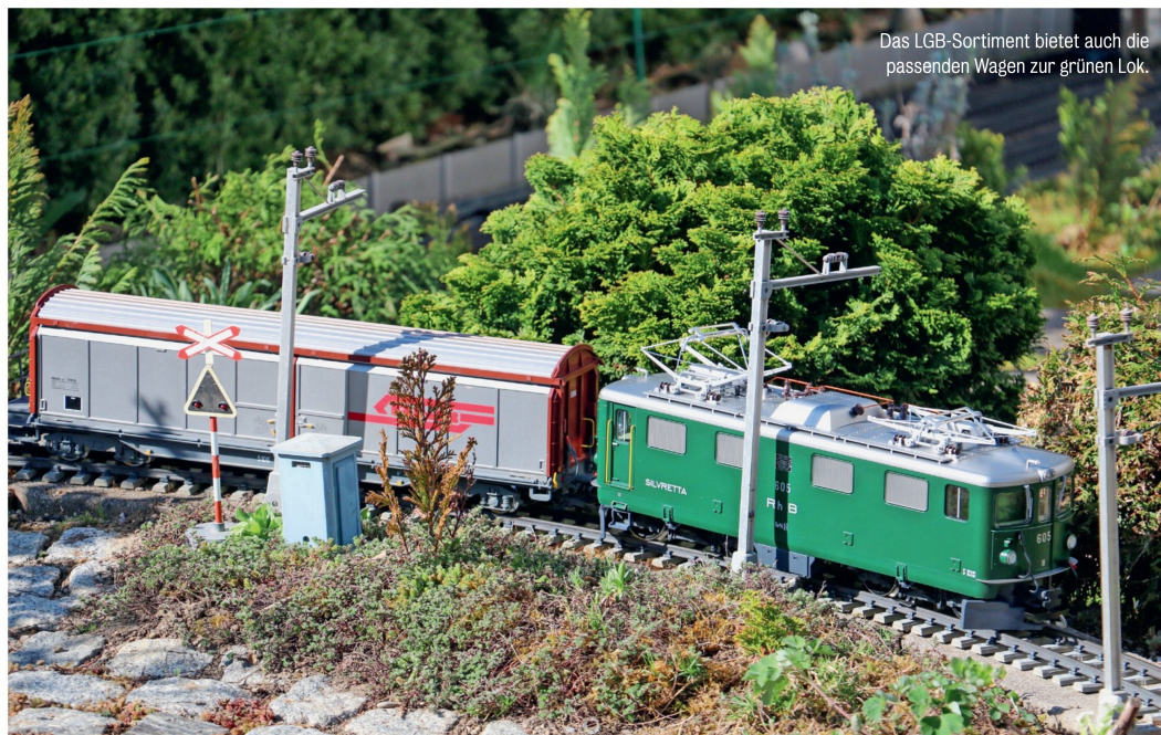
Das LGB-Sortiment bietet auch die passenden Wagen zur grünen Lok.