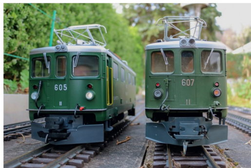
Ein Stelltdiehn der LGB 605 und der Kiss 607 in Metallausführung.