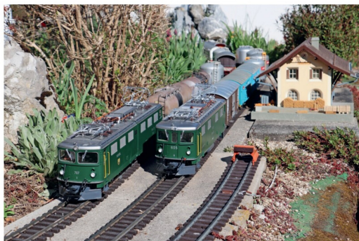
Begegnung der Ge 6/6 1 707 und der Ge 4/4 1 605 im Bahnhof von Susch.