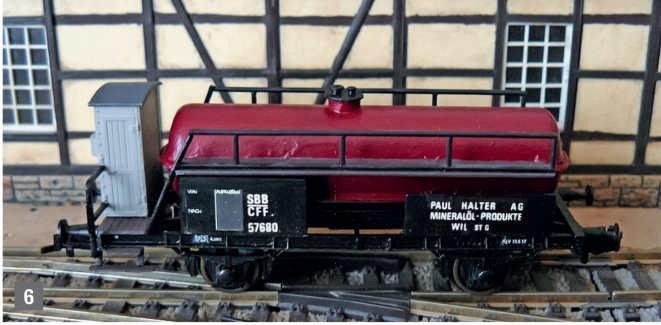
Bild 6: Da ich mit dem Säurekessel-Wagen nicht ganz zufrieden war, wurde er leicht überarbeitet und verfügt nun über ein anderes Geländer. Ausserdem wurden entsprechende Abziehbilder hinzugefügt.