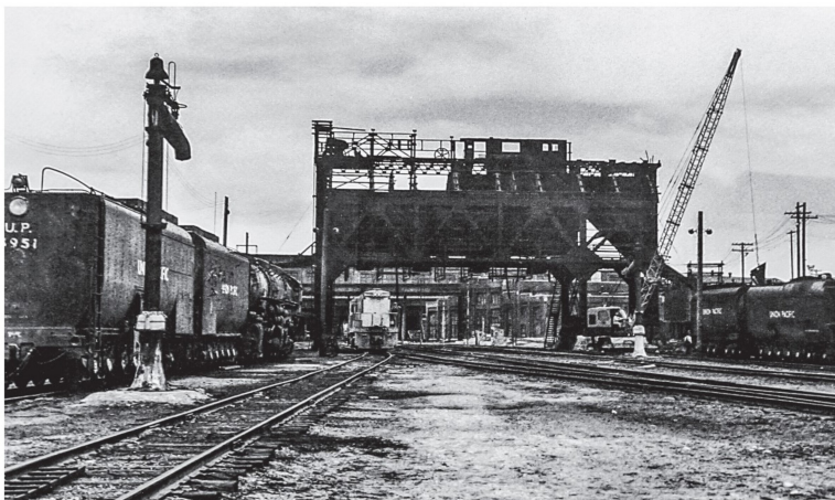
1962 während des Abbruchs der gigantischen Servicestation. Die Dampfkolosse sind kaltgestellt.