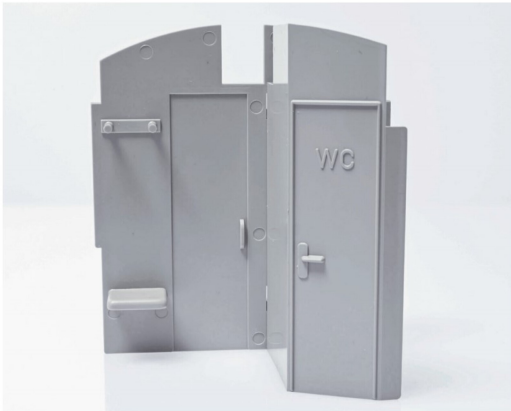
Etwas kahl präsentiert sich die Stirnwand des Wagens ab Werk.