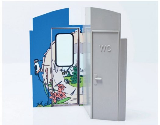
Nach dem Bekleben wirkt der Eingangsbereich um einiges realistischer.