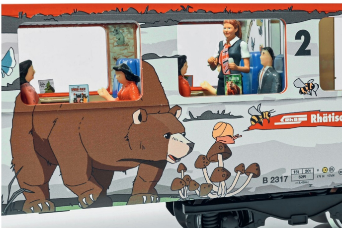
Auch die Bärenbücher finden an Bord des Wagens wie beim Vorbild ihren Platz am Fenster.