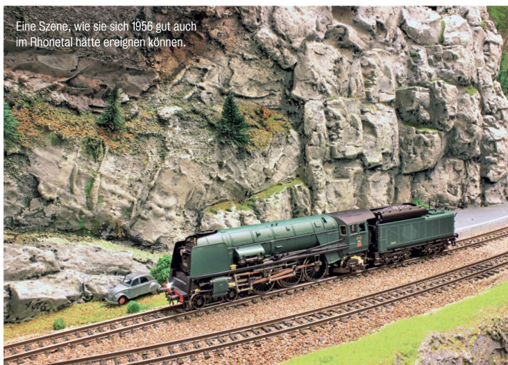
Eine Szene, wie sie sich 1956 gut auch im Rhonetal hätte ereignen können.