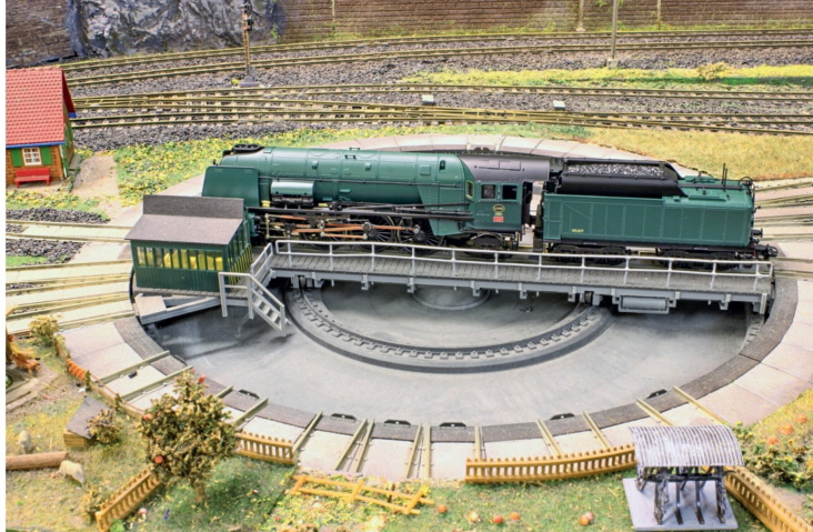
Die Maschine nimmt fast die ganze Drehscheibe des Eisenbahn-Modell-Clubs Biel ein.