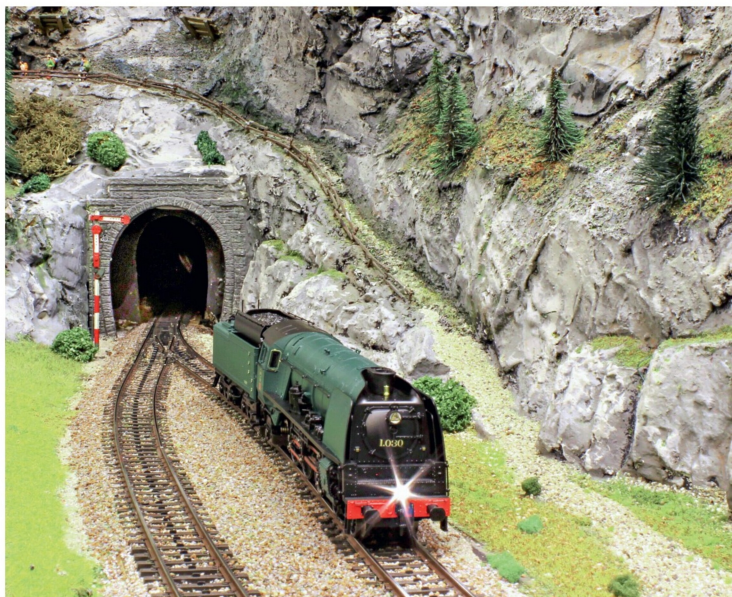
Das Überraschungsmodell 2020 von Märklin macht auch auf Schweizer Anlagen eine gute Figur.