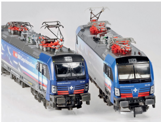
Zwei sehr ausdrucksstarke Vectron-Gesichter: Fleischmann (links) und Hobbytrain (rechts).