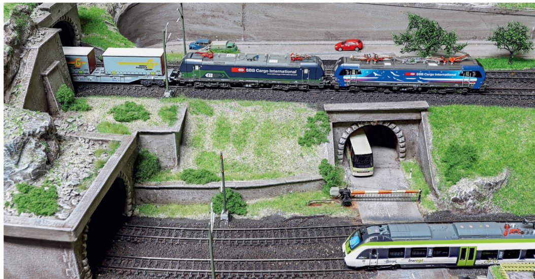
Im vollen Einsatz auf der Testanlage sind hier der Fleischmann- (vorne) und der Hobbytrain-Vectron (hinten) gemeinsam und gleichberechtigt am Zug.