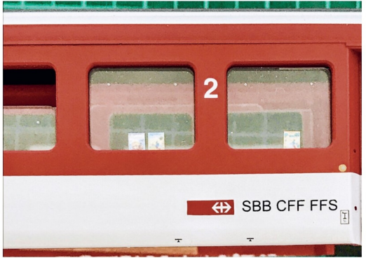
Auf den Tischchen stehen verkleinerte Globi-Bücher für die Kinder bereit.