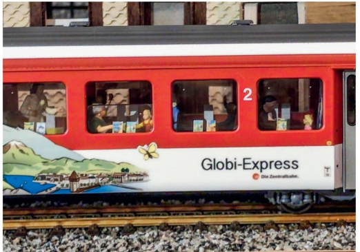
Erst mit Passagieren wird dem umgestalteten Wagen Leben eingehaucht.