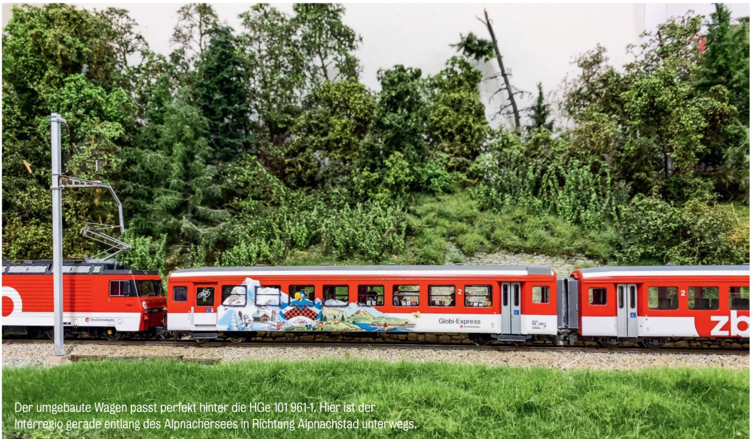
Der umgebaute Wagen passt perfekt hinter die HGe 101 961-1. Hier ist der Interregio gerade entlang des Alpnersees in Richtung Alpnachstad unterwegs.