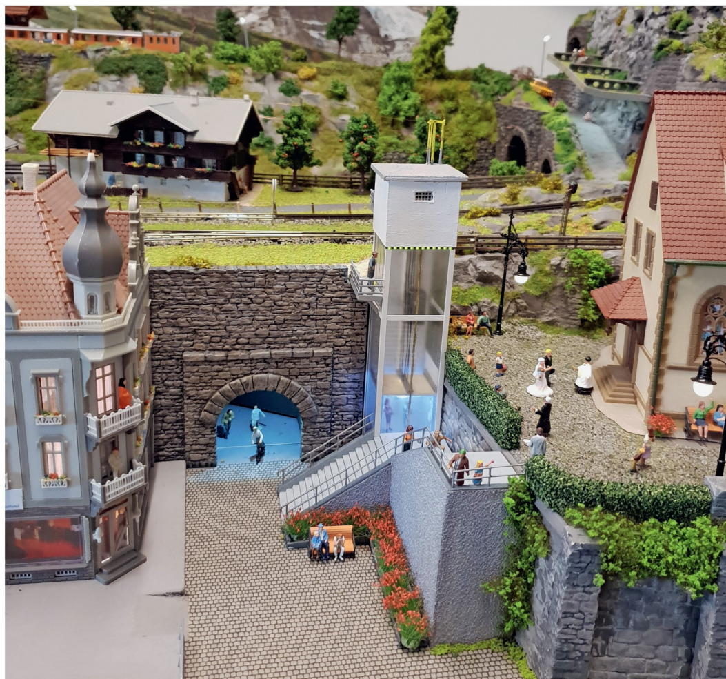
Am anderen Ende der Stadthauszeile befindet sich der Tunnel nach «Nirgendwo». Wohin er führt? Wir wissen es nicht ...