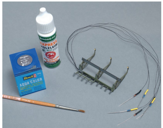
Die winzigen warmweissen Leuchtdioden wurden mit Weissleim verklebt und die glänzenden Klebestellen zusätzlich mit matter Farbe getarnt.