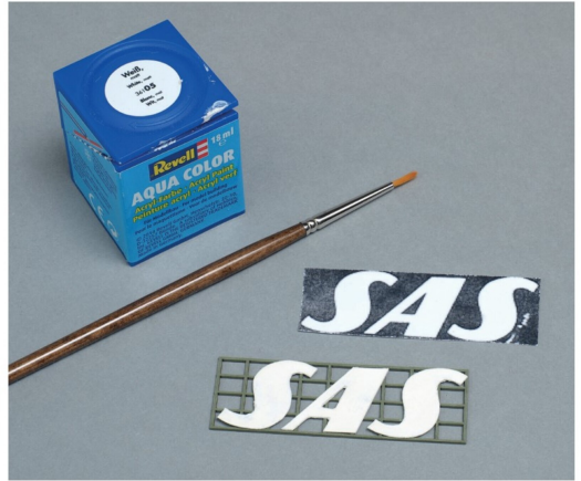
Das im Internet gefundene Logo wurde ausgedruckt und auf Karton aufgeklebt. Ein zweiter Ausdruck half bei der Ausrichtung der Buchstaben.