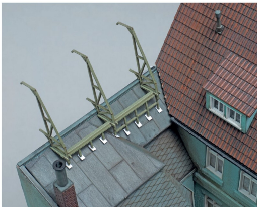
Zur korrekten Ausrichtung wurde die Tragekonstruktion für die Reklame sanft auf die Dachfläche gedrückt, solange der Leim noch nass war.