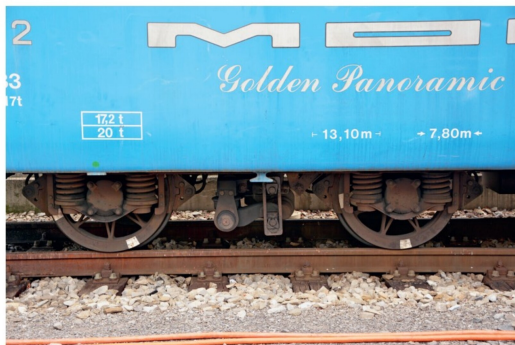
Der Blick auf die Drehgestelle zeigt, dass diese noch immer Speichenräder aufweisen. Auch wurden sie nicht wirklich umgebaut.