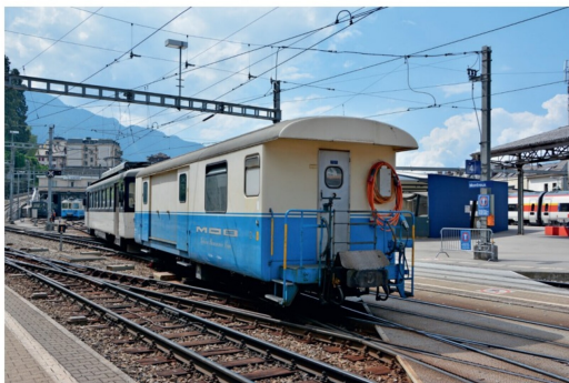
Fotografenglück: Am 22. Juli 2018 zog der Be 4/4 1006 (ex OJB Be 4/4 301 bzw. 86) den BD 33 in Montreux in Richtung Depot und Abstellanlage.

bei Ausfall eines Wagens mit Gepäckabteil (BD 204–206) als Ersatzfahrzeug zu letzten Ehren. Seit einigen Jahren trifft man das Fahrzeug am häufigsten an seinem Stammplatz, am Prellbock von Gleis 6 in Montreux. Im Sommer 2020 hatte das Fahrzeug noch nicht die neue automatische Kupplung SCHWAB erhalten. Ob das in Zukunft noch geschieht, konnte nicht in Erfahrung gebracht werden. Einsätze ausserhalb des Bahnhofs Montreux sind somit noch seltener geworden.