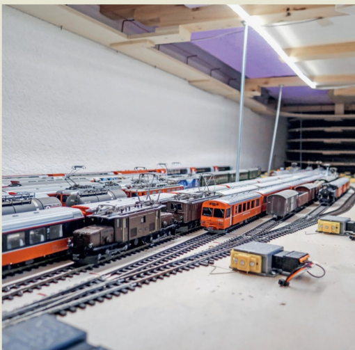
Der grosse Schattenbahnhof mag einige Zugkompositionen schlucken.