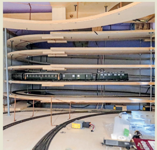
Die Gleiswendel bringt den Zug in die Einfahrkurve von Stugl/Stuls.