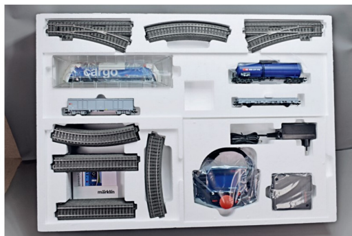
Märklin rüstet digitale Startpackungen mit der MS2 aus. Im Set enthalten ist ein Oval mit einem Ausweichgleis. Die Lok hat umfangreiche Soundfunktionen.