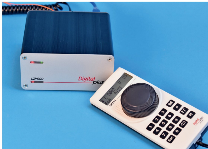
Lenz packt in seine Spur-0-Startsets gleich die grosse Digitalzentrale LZV200 und den aktuellen Handregler LH101. Spur-0-Startsets haben übrigens ein noch höheres Suchtpotenzial als H0-Startsets.

Spuren, also Spur 1 und Gartenbahn in IIm, sind derzeit von den Grossserienherstellern keine entsprechenden Startsets erhältlich. Wer digital fahren will, muss analog starten und zu digital konvertieren. Immerhin sind die Produkte von PIKO, LGB und Märklin so weit vorbereitet, dass der Wechsel relativ einfach ist. Es gibt aber kein Auspacken, Zusammenstecken, Losfahren.