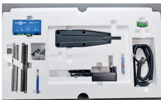
Das Tillig-Startset hat eine zweite Ebene mit allerlei nützlichem Zubehör. Bemerkenswert ist der Schraubenzieher. So ist sichergestellt, dass der Aufbau des Startsets sofort gelingt.