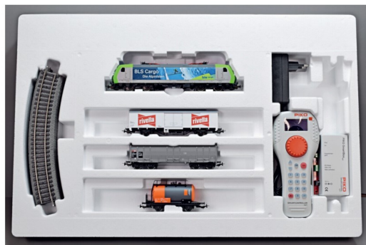
PIKO hat vor einiger Zeit sein Gleissystem mit einer zusätzlichen Bettung ausgerüstet. So werden die Startsets noch attraktiver.