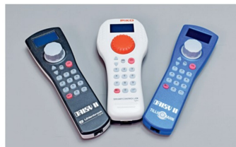
Links die Daisy 2 von Uhlenbrock, rechts die blaue Variante von Tillig. In den A.C.M.E.-Startsets ist sie in einer roten Variante enthalten. Der Smart-Controller light in der Mitte ist die PIKO-Version.