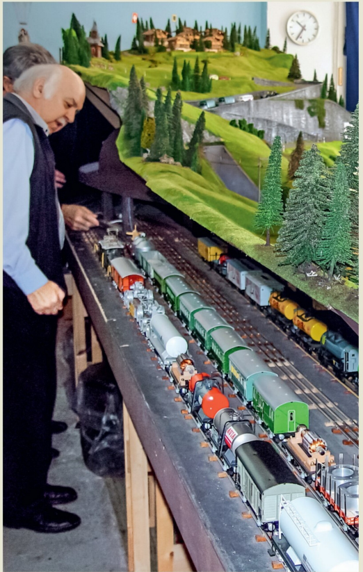
Säulenfreier Zugang hinter der Anlage. Man beachte die langen Züge!