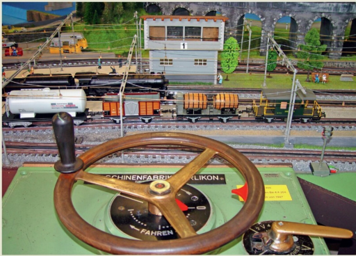
Ein echter Lokregler, umgebaut von Andreas Sennhauser (ASE) aus Schlieren.