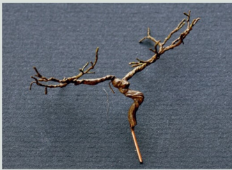
Anstrich mit Dunkelbraun, Beige und Dunkelgrün.