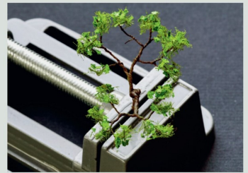
Verleimung der Blattelemente mit UHU Hartkleber.