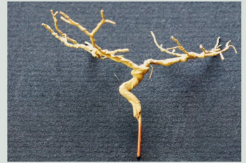
Grundieren mit Heki-6600-Strassenfarbe.