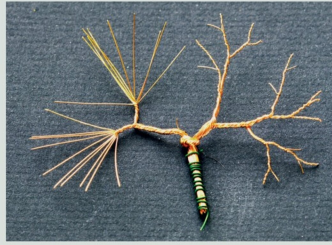
Wiederholung der Schritte für die zweite Hälfte.