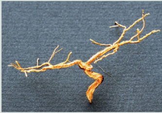
Grüne Drahtumwicklungen entfernen.