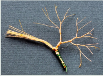
Zusätzliche Aufspreizung zur Feinstverästelung.