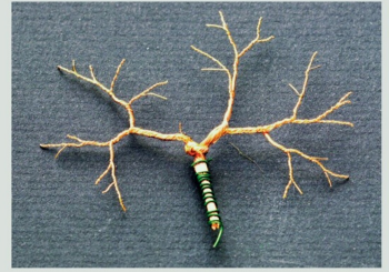
Die Rebstockverästelung ist nun fertig.