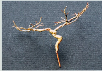
Verlätten des Rebstockes mit einem Draht.