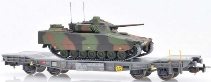
Der moderne Spz 2000 Hägglunds auf einem Slmmnps-y mit Scheibenbremsen.

Interessierten Lesern wird das Buch «Schweizer Privatgüterwagen ab 1980» aus dem Verlag Ochsner ( www.verlag-ochsner.ch ) empfohlen. Dort finden Sie viele weitere Informationen und Bilder zu diesen Güterwagen (und natürlich auch zu allen anderen Privatgüterwagen der Schweiz).