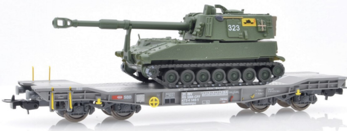
Nochmals ein Panzer M109 auf dem Slmmnps, diesmal in grüner Farbgebung.