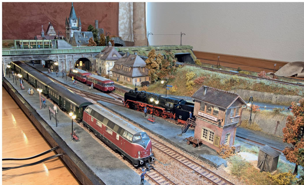
Überblick über den mittleren Teil. Zu sehen sind die Verbindungsbrücke und das BW. Schön versammelt sind Diesellok, Dampflok und Schienenbus.