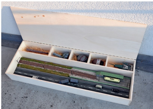
Aufbau 3: Einige Teile werden aus der separaten Kiste genommen.