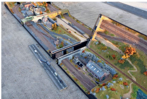
Aufbau 2: Die Kästen werden aufgeklappt und enthüllen ihr buntes Inneres.