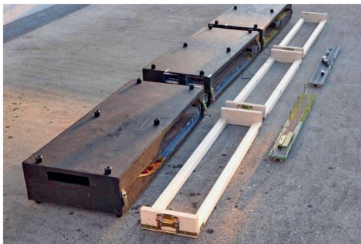
Aufbau 1: Alle Kästen und die Traggestelle nebeneinander platziert.