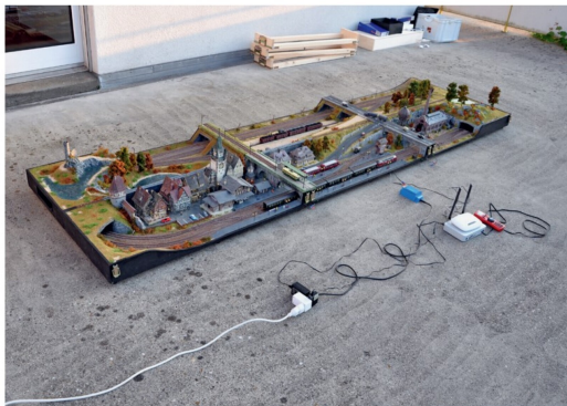
Aufbau 4: Die Kästen werden miteinander verbunden. Spielspass marsch!