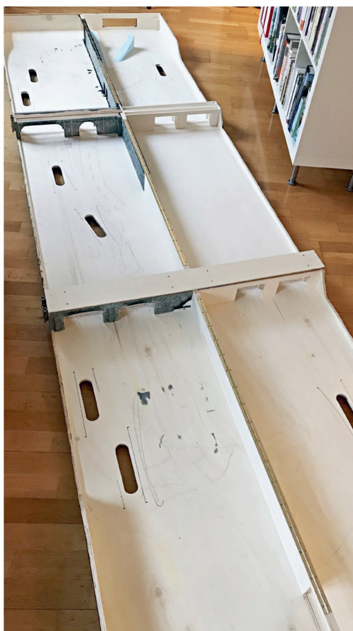
Alle Teile mit den ausgesägten Löchern für den Zugriff auf die Weichenmotoren.