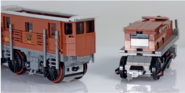
Eine Steckverbindung zwischen Vorbau und Mittelteil sorgt für die Gelenkigkeit des Krokodils.