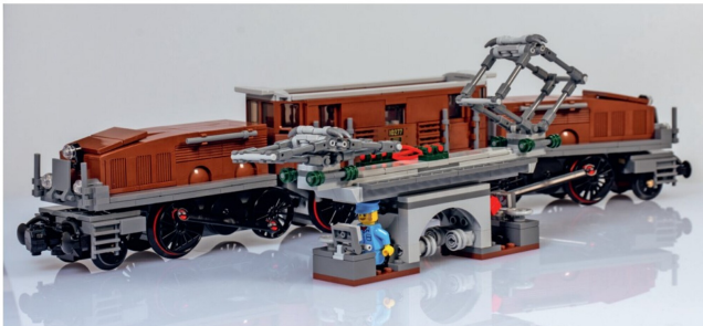
Mit nur einem Handgriff lässt sich das Dach der Krokodil-Lokomotive mühelos abnehmen.

bestehende Bausatz aufgelegt. Geliefert wird das Modell in einer edlen schwarz gehaltenen Kartonverpackung, in der sich neben einer mehr als 100 Seiten umfassenden Bauanleitung auch sechs Beutelgruppen mit LEGO-Steinen befinden. Neben dem eigentlichen Modell sind im Lieferumfang des Sets noch die Figuren einer Lokführerin und eines Lokführers sowie ein Schaugleis zur Präsentation des Modelles dabei. Das Modell besteht aus drei Teilen: den beiden Vorbauten mit den imitierten Motoren und dem herausnehmbaren Mittelteil.