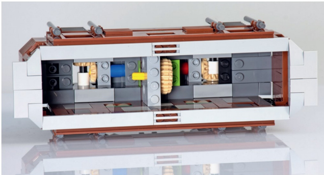
Blick in den Maschinenraum. Hier lässt sich der optionale Motor in das Modell einbauen.