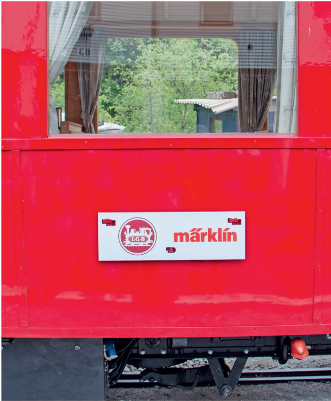
Ein nicht alltägliches Zuglaufschild am WR-S 2027, der als Steam-Pub-Wagen der DFB bekannt ist.

Anders als bei den Modellen aus dem Standardassortiment ist die HG 4/4 nicht als Kunststoff-, sondern als Zinkdruckgussmodell ausgeführt und mit technischen Details versehen. So wurde ein Vierfach-Raucherzeuger eingebaut, welcher für den Dampfausstoß am Kamin, bei den Zylindern, bei der Pfeife und bei der Vakuumbremse sorgt. Technisch ist es sogar möglich, das filigrane Modell durch den engen LGB-R1-Radius von 600 mm zu fahren, allerdings funktioniert der Zahnradantrieb erst in den größeren Radien.