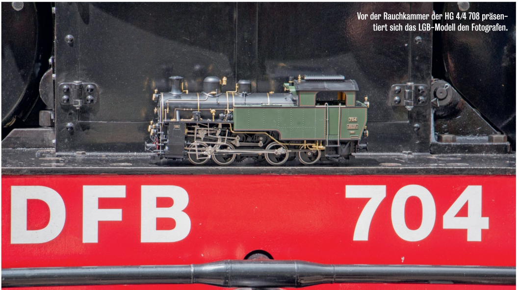
Vor der Rauchkammer der HG 4/4 708 präsentiert sich das LGB-Modell den Fotografen.