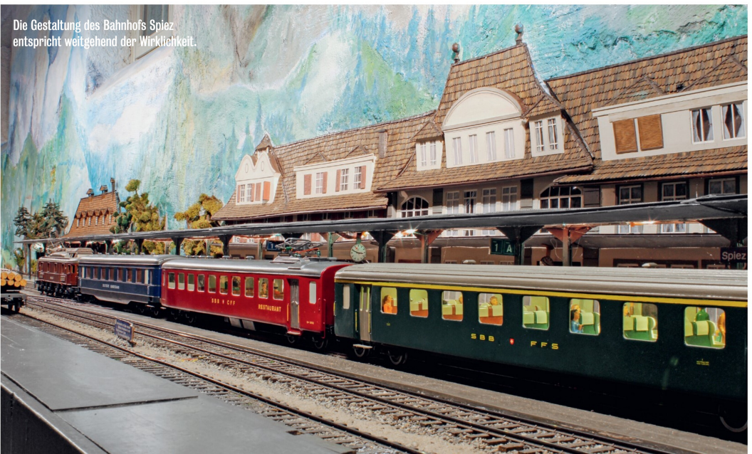
Die Gestaltung des Bahnhofs Spiez entspricht weitgehend der Wirklichkeit.