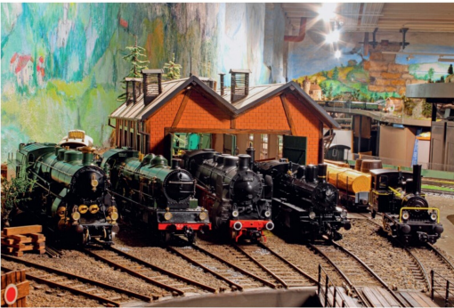
Die Echtdampflokomotiven der Basler sind zum Teil selbst gebaut.