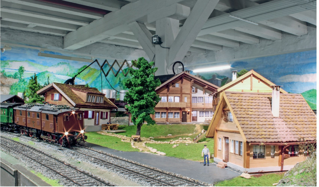
Im Kellergeschoss des Klubhauses befindet sich die Spur-1-Anlage. Auch bei dieser ist die Streckenführung der Fantasie der Erbauer entsprungen.