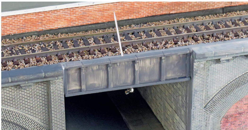
Nach einem schnellen ersten Anstrich mit Acrylfarbe wurde die Trägerseite mit Scenic Glue von Woodland Scenics, der schön dickflüssig und deshalb für diese Aufgabe bestens geeignet ist, in Position gebracht. Der Träger wurde mit einem Schaumstoffnagel von Woodland Scenics fixiert, während der Leim aushärtete.