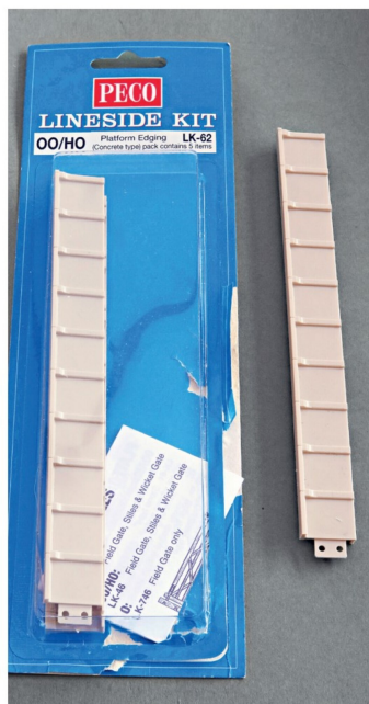
Als Stahlträger verwendete ich ein Stück Betonperronkante LK-62 von Peco im Massstab OO/HO.