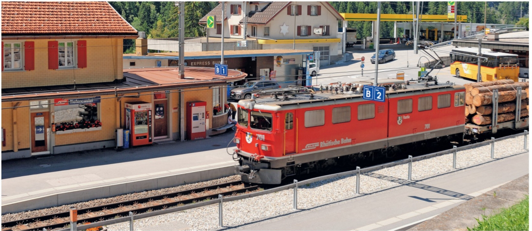
Das Gleis 1 ist nicht nur dem Personenverkehr vorbehalten. Auch Güterzüge wie dieser Zug mit Holz für Italien benutzen es zur Durchfahrt.