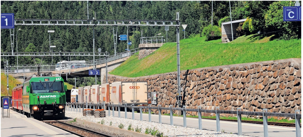
Der Güterzug Richtung Chur fährt bis knapp vor das Ausfahrtsignal, um dem Personenzug die Einfahrt nach Tiefencastel zu ermöglichen.