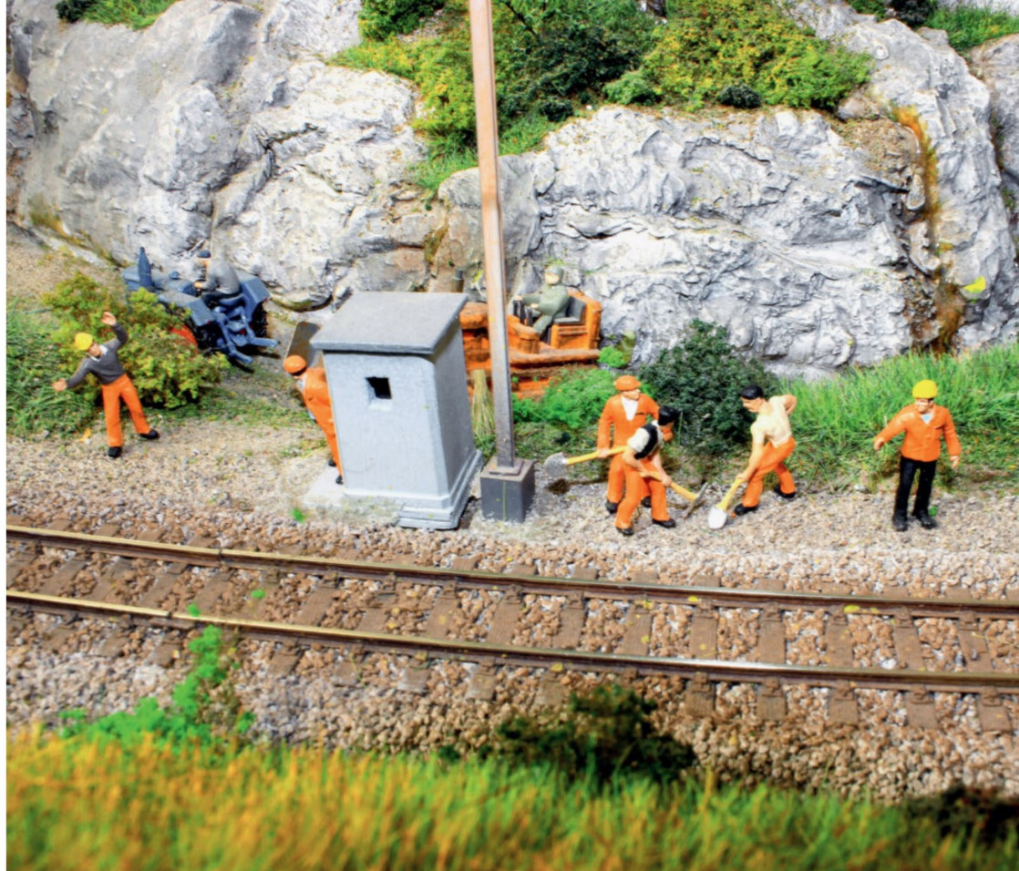
Auch der Unterhalt darf nicht fehlen: In den kurzen Zugspausen im Einspurabschnitt unterhält die Baudienstgruppe den Schienenerbau.