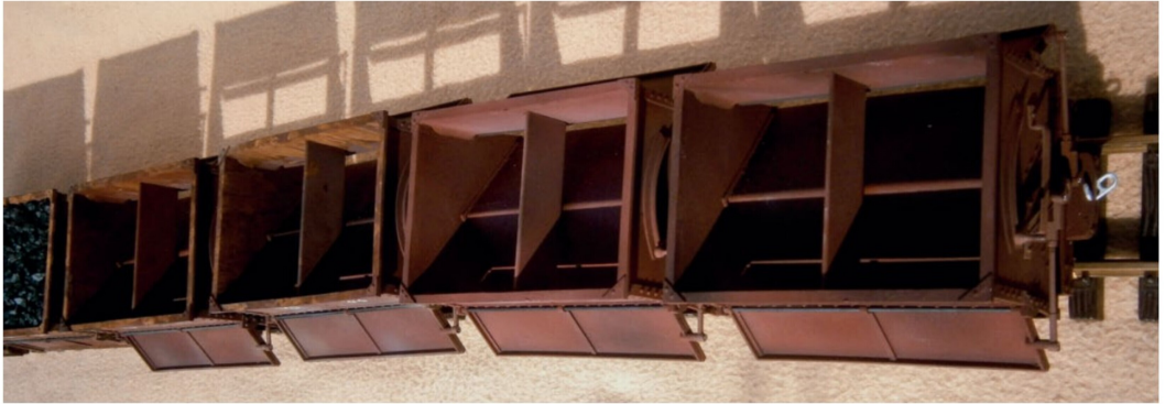
Ein Satz leerer Wagen mit offenen Klappen. Lediglich die rostrote Farbe wurde aufgesprüht, Spuren von Alterung sind noch nicht erkennbar.