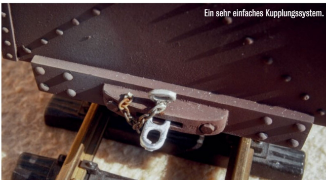
Ein sehr einfaches Kupplungssystem.

Eine Kohleladung rundet das Erscheinungsbild dieses Bergbaugerätes ab. Die Ladung besteht aus echter Kohle, die ich in kleine Stücke geschnitten habe. Diese habe ich dann mit Weissleim auf einen Polyurethanträger geklebt.