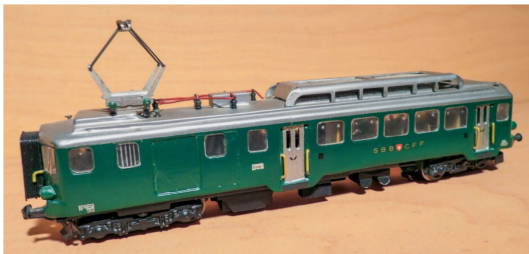
1959 ist der Triebwagen BDe 4/4 auf Anregung eines Bekannten aus Basel aus Araldit entstanden. Das Chassis stammt von einer V200 von Märklin.