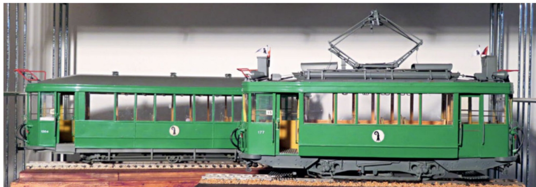
Der Motorwagen Be 2/2 177 und der Anhänger B3 Nr. 1304 der Basler Strassenbahnen sind im Eigenbau am Küchentisch entstanden.