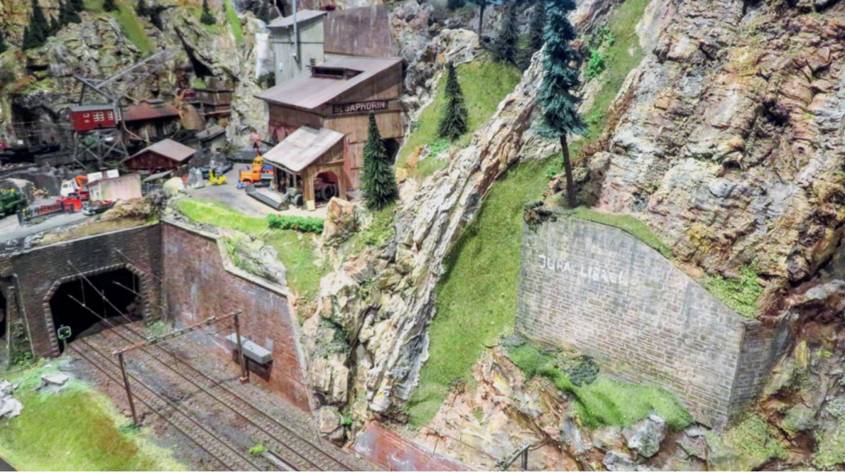
Feierabend im Kieswerk St. Saphorin. An der Stützmauer davor verdeutlicht eine politische Parole, in welcher Landesgegend wir uns befinden.