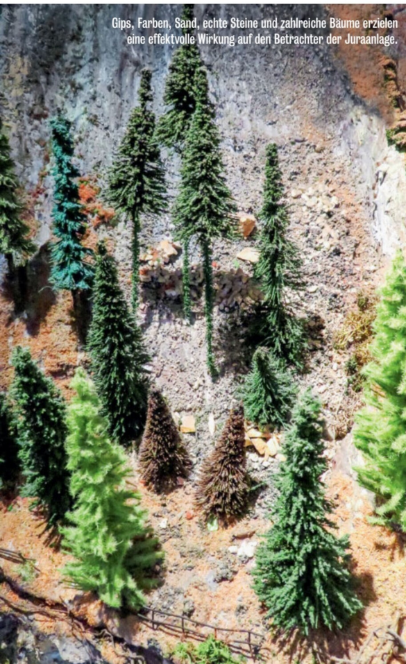
Gips, Farben, Sand, echte Steine und zahlreiche Bäume erzielen eine effektvolle Wirkung auf den Betrachter der Juraanlage.