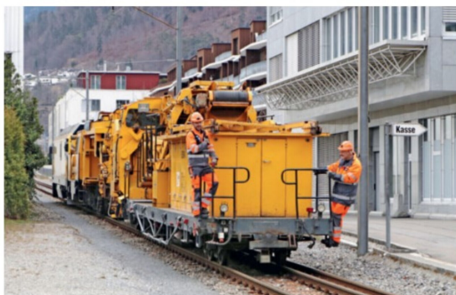
Letzte Fahrt auf dem Anschlussgleis zum Churer Recyclingunternehmen.