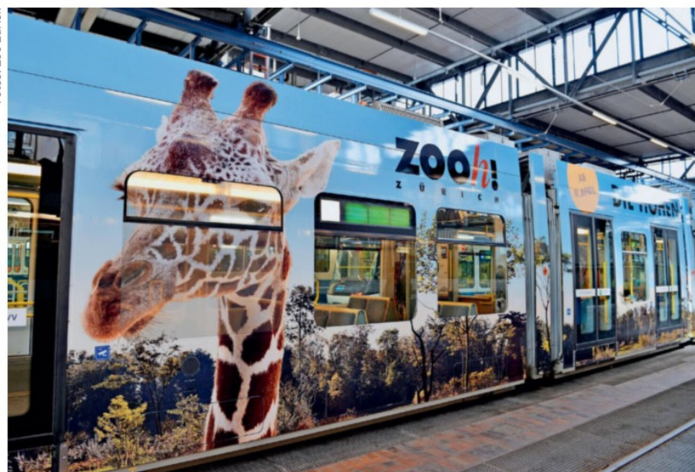
Grosse Giraffen grüssen von einem Cobra-Sondertram vom Zoo Zürich und der VBZ.