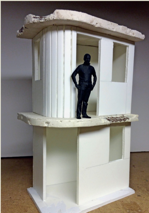
Die Decken des Eckgebäudes sind aus Gips gegossen.