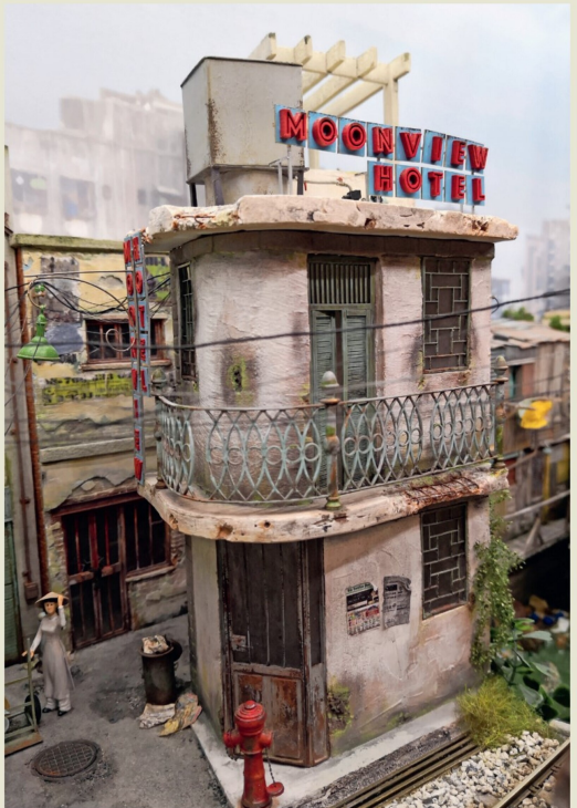
Türen und Fenster sind aus Kunststoff und selbst gelasertem Karton.