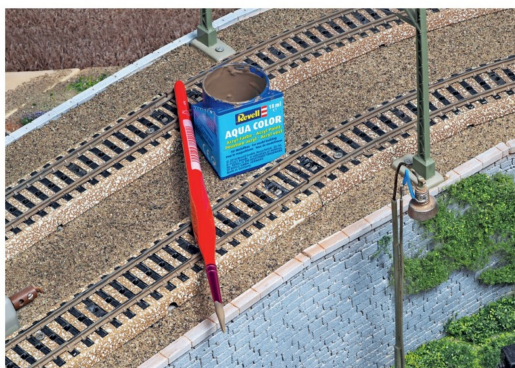
Die Gleisprofile werden mit erdbrauner Farbe gestrichen, die dem üblichen Rost sehr nahe kommt.