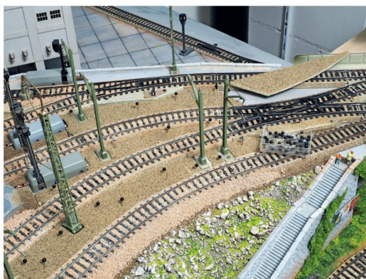
Im Bahnhofsbereich werden die Gleiszwischenräume mit zugeschnittenen Schaumstoffplatten gefüllt, die vorgängig mit Sand bestreut wurden.