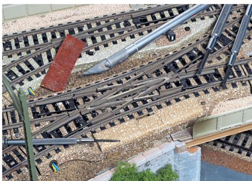
Bei Kreuzungen und Weichen erfolgt das Verrosten wegen der beweglichen Teile in Etappen, danach werden die kontaktführenden Stellen gereinigt.