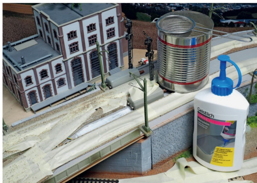
Der Unterbau oder die seitlichen Bankette entstehen aus feinem Sand, der mit einem Sieb auf den Leim verteilt wird.