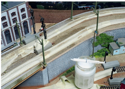
Die endgültige Fixierung erfolgt durch das bekannte Leim-Wasser-Gemisch. Die Gleise werden mit Abdeckband geschützt.