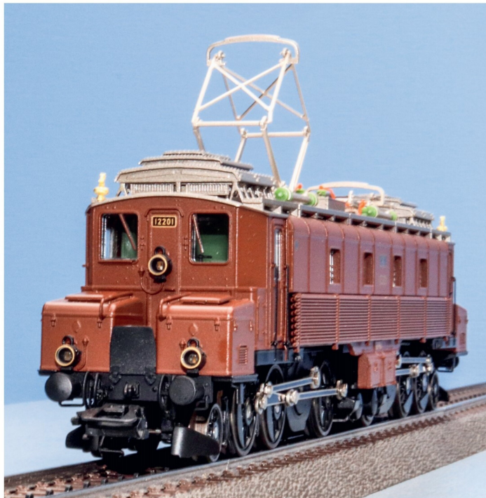
Das Aussehen und die Detaillierung des Modells beeindrucken, das Vorbild wird getreu wiedergegeben.