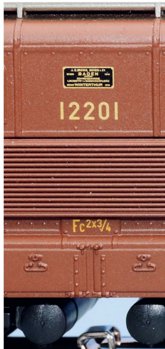
Die Geschichte der Lok kurz zusammengefasst.