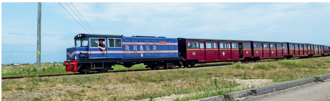
Die Diesellokomotive Nr. 14 Captain Howey in Blau-Silber (Baujahr: 1989) mit dem roten Wagenzug kurz vor dem Bahnhof in Dungeness.

Die RH&DR verfügt über einen grossen Wagenpark von aktuell 63 Personenwagen für den täglichen Betrieb und einigen historischen Fahrzeugen, welche an Sonderanlässen zum Einsatz kommen. Die Personenwagen tragen die Farben Grün, Blau, Rot und Braun. Es sollen jeweils zehn Wagen von