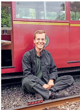
Der Erbauer mit einem der ersten Modelle.