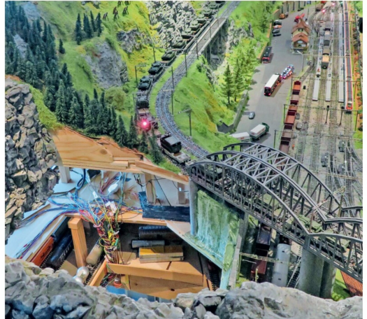
Der Betrachter wird Teil der Anlage: Eine Öffnung schafft Zugang zu den Schattenbahnhöfen und ermöglicht ungewohnte Ausblicke auf die Anlage.