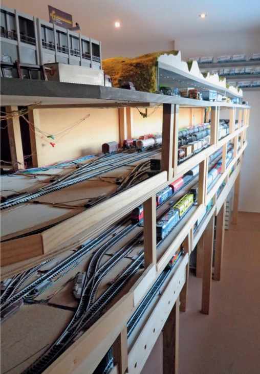
Die stattlichen Schattenbahnhöfe mit insgesamt 35 Gleisen ermöglichen regen und abwechslungsreichen Fahrbetrieb auf den drei Ebenen.