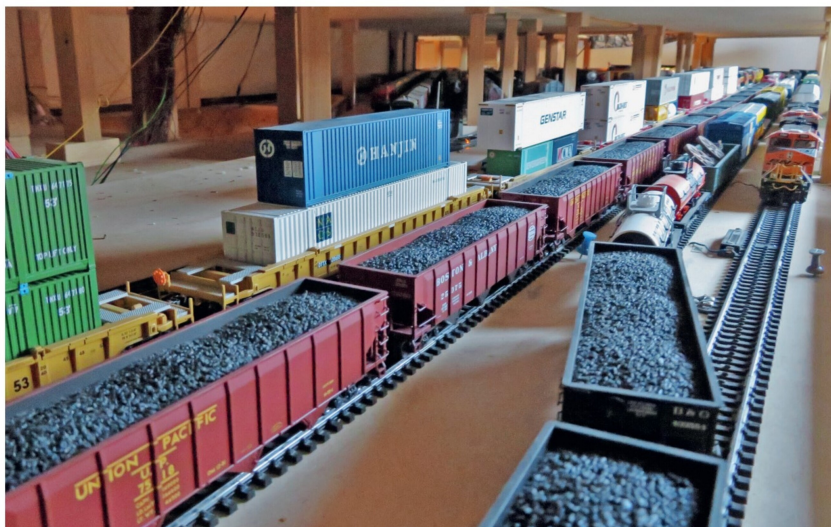
Im Schattenbahnhof der untersten Ebene wartet bereits der Erzzug auf seine Ausfahrt. Mit 30 Wagen und 6,7 Metern ist er der längste Zug auf der gesamten Anlage.