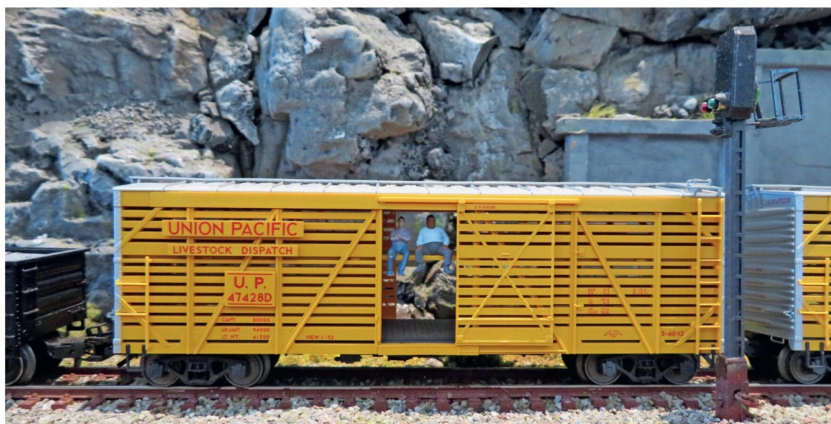
Der Fotograf fängt eine typische US-Szene ein, die aus einem Film stammen könnte. Im ersten Viehwagen des langen Dampfgüterzugs reisen zwei blinde Passagiere mit.