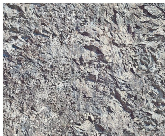
Variante 1, grau.

Das Gestalten von Felsstrukturen erfolgte bis dato meist mit Gips. Eine neue interessante Methode zum Bau von Felsformationen stellen die neuen Knitterfelsen von Atelier Dietrich dar.