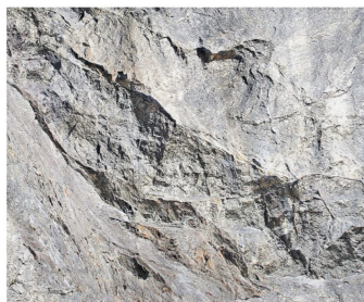
Variante 3, «Steile Felswand».