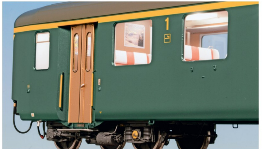
Die Farbfotos an den Wänden entsprechen exakt den SBB-Vorbildern.