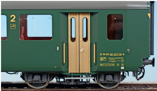
Die Qualität der Beschriftung lässt ebenfalls keine Wünsche offen.