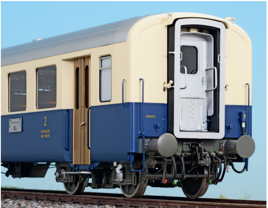
Die Einheitswagen der GBS sind die einzigen blau-creme Wagen der BLS-Gruppe, die mit Faltenbälgen ausgeliefert wurden.