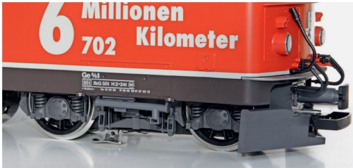
Die Stromabnahme erfolgt primär über die vier Räder der Enddrehgestelle.