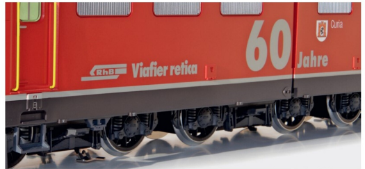
Die Enddrehgestelle sind zusätzlich mit Schienenschleifkontakten versehen.