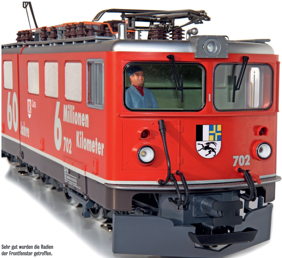
Sehr gut wurden die Radien der Frontfenster getroffen.