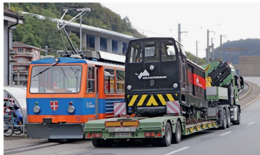
Der Bhe 4/8 12 leistet bei der Ankunft bereits Gesellschaft.