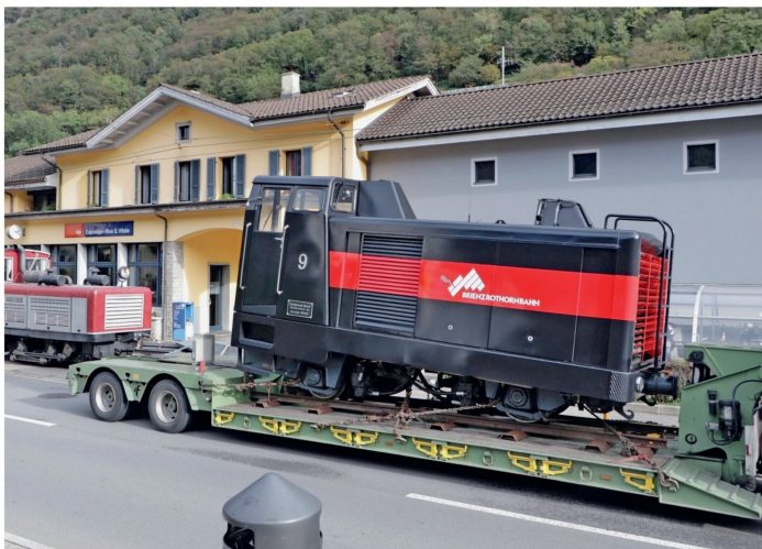
Die BRB Hm 2/2 9 bei der Anlieferung neben der kleinen Hm 2/3 1 der MG.