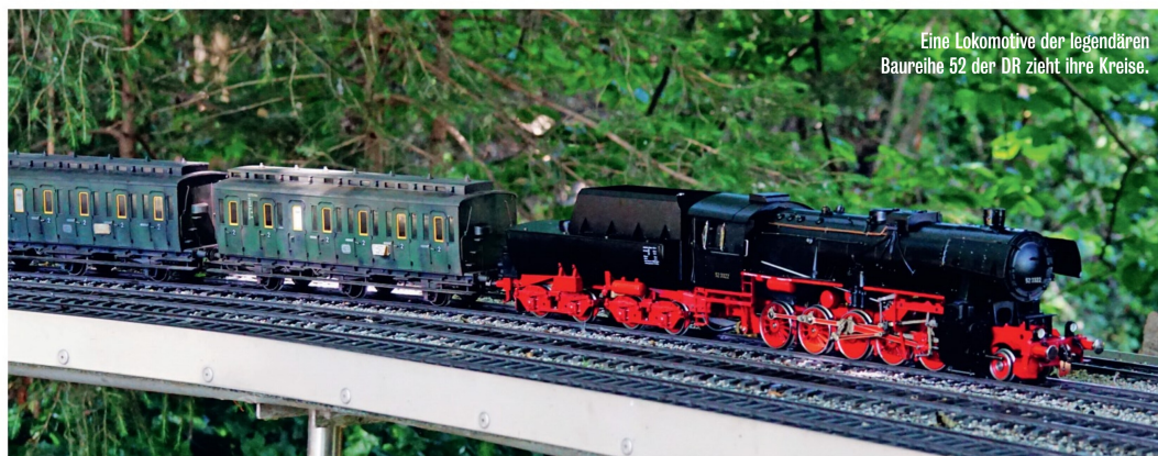
Eine Lokomotive der legendären Baureihe 52 der DR zieht ihre Kreise.