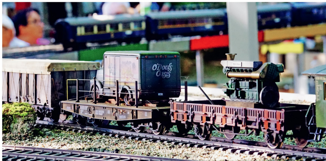
Die Modellbauer warteten mit etwas Herzklopfen, bis sie an der Reihe waren, um ihre Modelle auf der Anlage vorzuführen.