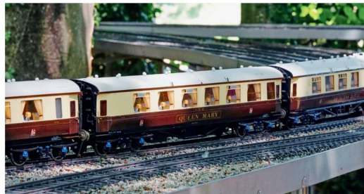
Speisewagen «Queen Mary» der Great Western Railway.