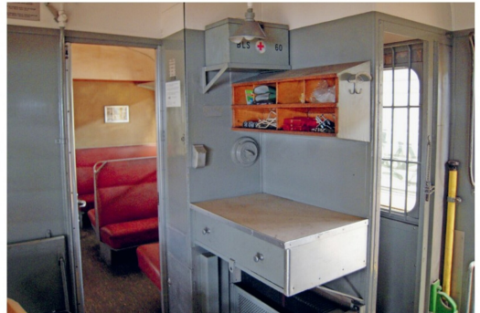
Der Gepäckraum mit Zugführerpult, rechts die Gefangenenzelle.