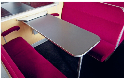
Die Tische lassen sich entfernen. Hier ein Exemplar im Zweitklassabteil.