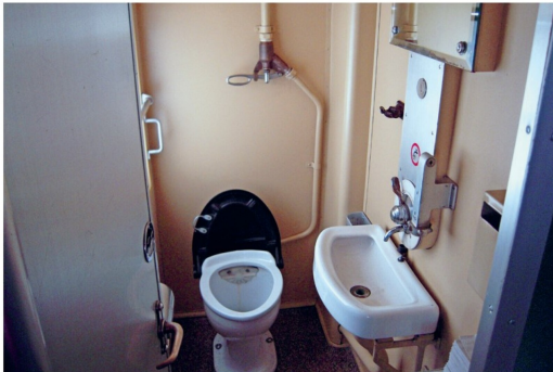
Das WC im BCFe 4/6 736 befindet sich noch im Originalzustand.