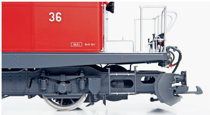
Jede Achse ist, wie beim Vorbild, mit einem Zahnrad System LGB ausgerüstet.