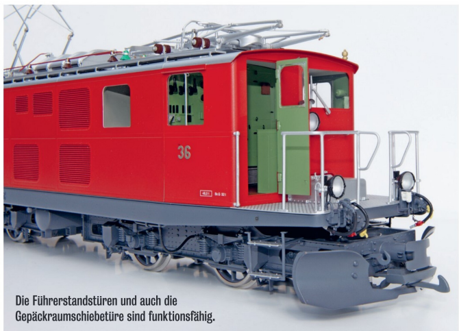
Die Führerstandtüren und auch die Gepäckraumschiebetüre sind funktionsfähig.

eine aktive Hebeverhinderung ein irrtümliches Heben der Stromabnehmer auszuschliessen und so die filigranen Pantos vor Schäden zu schützen. Die Beleuchtung ist nach Schweizer Signalreglement ausgeführt. Die eingeschaltete Führerstandsbeleuchtung löscht beim Anfahren nicht automatisch, sondern originalgetreu wie beim Vorbild erst dann, wenn der Lokführer auch den Schalter (die Funktion) betätigt.