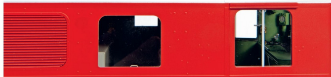
Die Stromabnehmer werden bei Kiss seit dem RHB-Ge-4/4 II -Modell inhouse produziert.