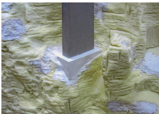
Jeder Pfeiler bekommt noch einen passenden Sockel aus Gips.