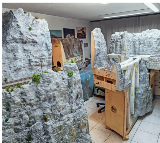
Beim Felsenfärben muss die fertige Brückenkonstruktion abgedeckt werden.