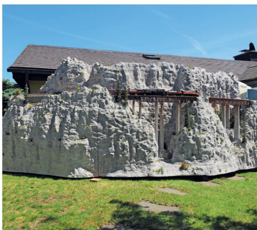
Die drei neuen Module beim Fotografieren im Freien.