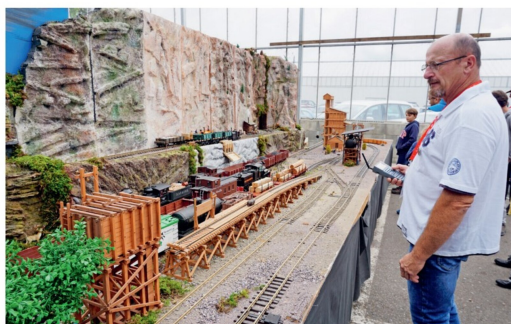
(Auch) auf dieser Anlage zischte, ratterte und dampfte es zünftig.