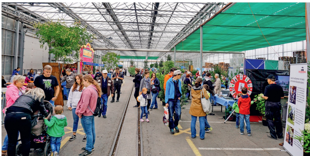
Die Organisatoren waren vom Publikumsansturm sehr positiv überrascht. Ob es eine Fortsetzung gibt, ist vorderhand noch offen.