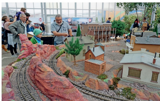
Dreams on Wheels: die Modelleisenbahnanlage der US G-Scale Friends.