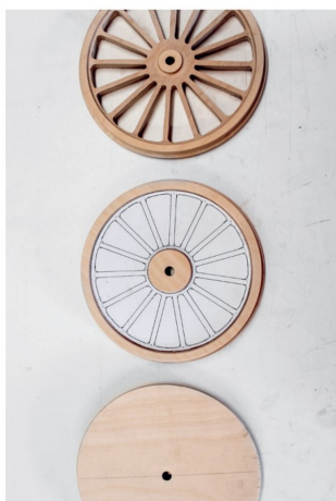
Aus mechanischer Sicht funktionsfähig.