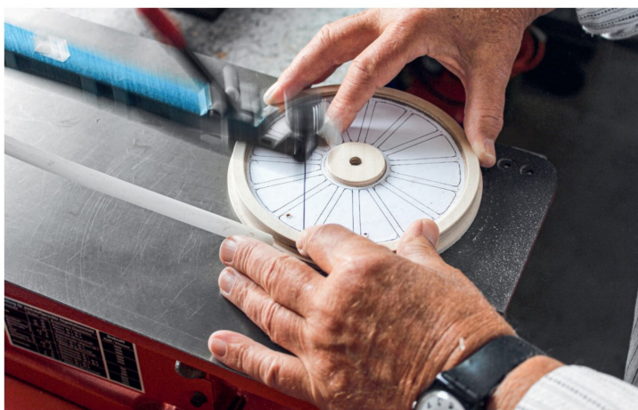
Für den Bau einer Lokomotive benötigt Urs Roth etwa zwei Jahre – in gemütlichem Tempo.