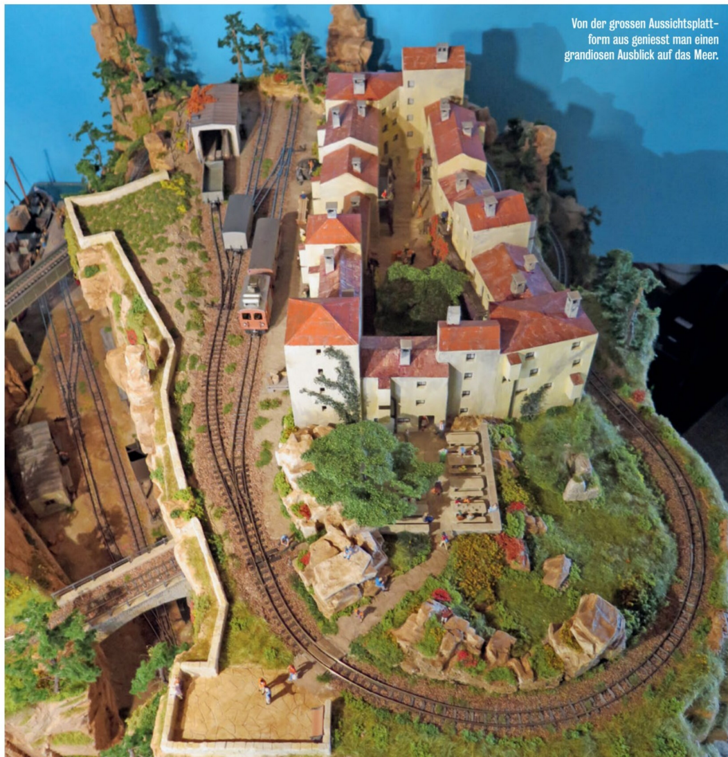
Von der grossen Aussichtsplat- form aus geniesst man einen grandiosen Ausblick auf das Meer.