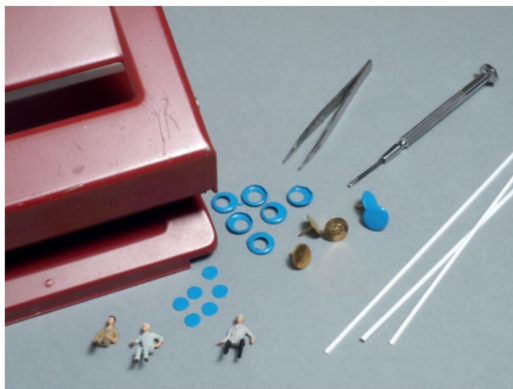
Die zeittypischen Sitzgelegenheiten entstanden aus den Abdeckungen von herkömmlichen Reissnägeln und kleinen U-Profilen aus Polystyrol.