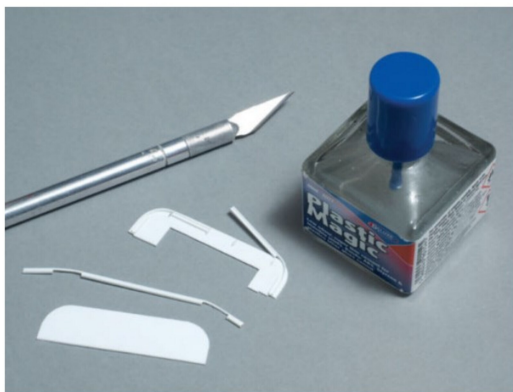
Die kleinen U-Profile wurden nach und nach auf die Theke geklebt. Im Vordergrund die Teile für den oberen Abschluss der Verglasung.