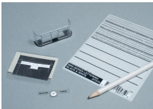
Die Bahnhofsuhr und die Beschriftung aus Aufreißbuchstaben befinden sich auf einem transparenten Plättchen, das separat angebracht wurde.