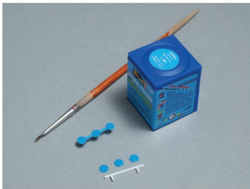
Die Tragkonstruktion der Sitzgruppen wurde mit lichtblauer Farbe von Revell gestrichen, und danach konnten die Sitzteller aufgeklebt werden.