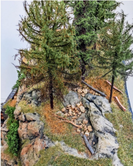
Der Wald auf dem Tunnel Wiesen I ist sehr realistisch gestaltet.