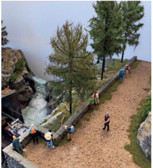
Der Aussichtspunkt an der Zügenstrasse ist ein gutbesuchter Ort.