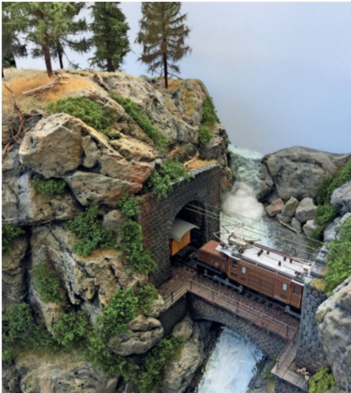
Eine Ge 6/6' «Krokodil» mit Güterwagen fährt in Richtung Davos.